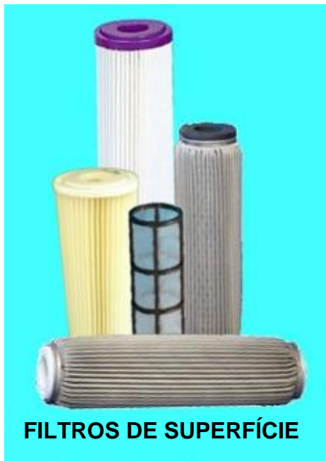
FILTROS DE SUPERFÍCIE