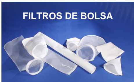
FILTROS DE BOLSA